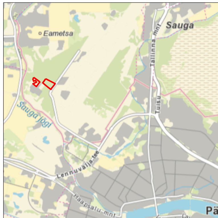
Kaardilehed nr 5332 Pärnu, 5334 Pärnu-Jaagupi